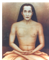
Kriya Babaji Nagaraj